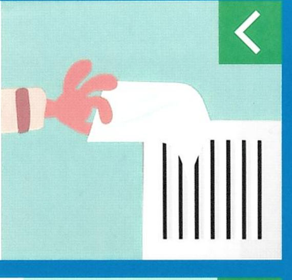
Приложите лист бумаги к вентиляционной решетке. Если бумага притягивается, тяга есть.