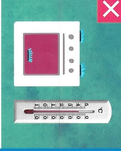
Нельзя пользоваться газовыми плитами для обогрева помещений