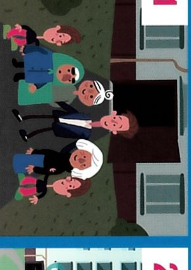
из загазованнои среды и сообщите Постарайтесь удалить людеи