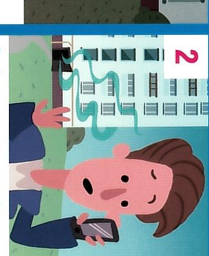
службу из незагазованного места Сообщите в газовую аварийную