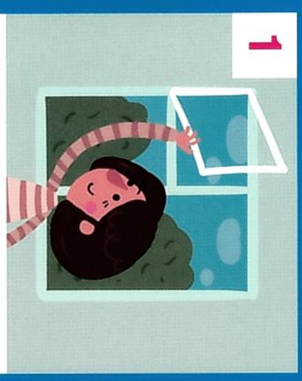
Откроите окна для проветривания помещения