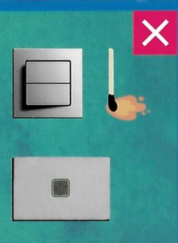
открытого огня или искры и лифт. Не допускайте появления Не используйте электроосвещение