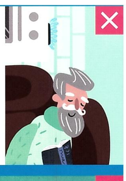
Нельзя использовать для сна помещения, в которых установлены газовые плиты